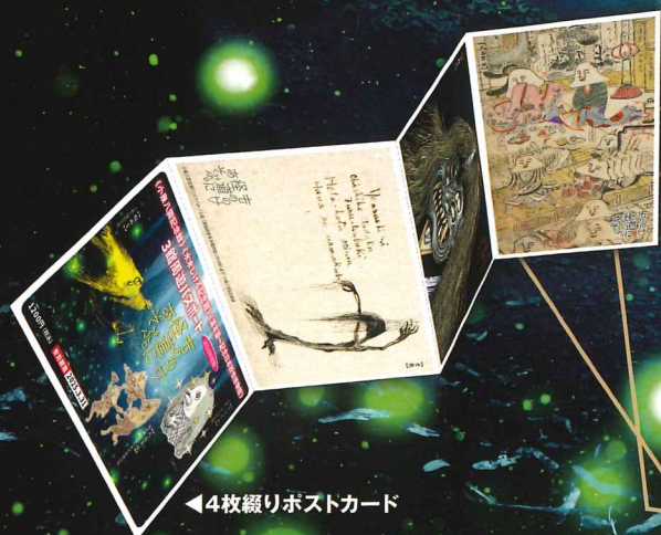
◀4枚綴りポストカード