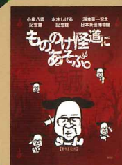
◀特製クリアファイル